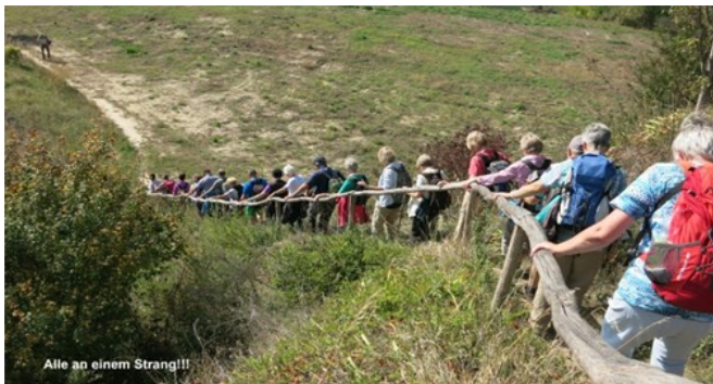
Alle an einem Strang!!!

Auf dem Lösshohlwegepfad wurde auf Infotafeln über die Geschichte dieser regionalen Landschaftsprägung aufgeklärt