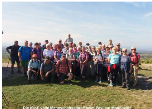
Die (fast) volle Mannschaftsstärke beim Pavillon Mondhalde

Nach schönen Wanderungen wurde noch auf der Heimfahrt die drittgrößte Stadt des Elsass, Colmar, mit seinen Sehenswürdigkeiten (Isenheimer Altar...) besucht.